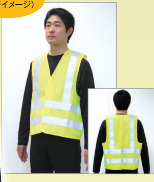
イエロー (装着イメージ)