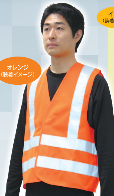
オレンジ (装着イメージ)